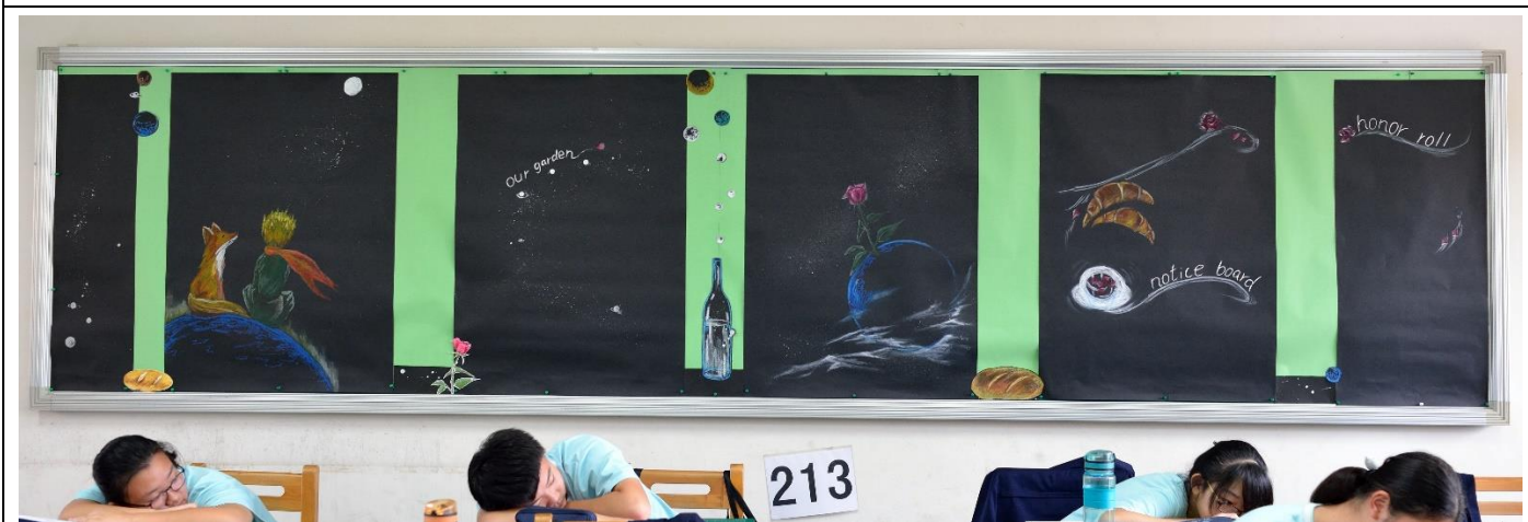
第五名 二年 10 班