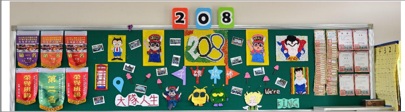
佳作 二年 9 班